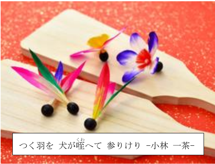
つく羽を 犬が くわ 唾へて 参りけり -小林 一茶-