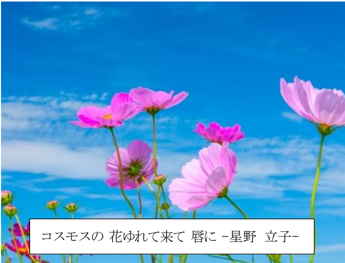
コスモスの 花ゆれて来て 唇に -星野 立子-