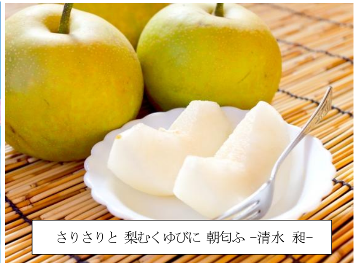
さりさと 梨むくゆびに 朝匂ふ -清水 昶-