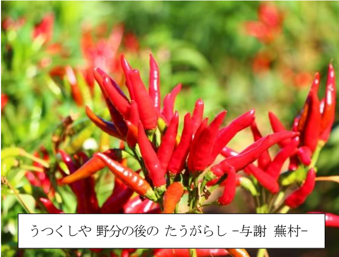
うつくしや 野分の後の たうがらし -与謝 蕪村-