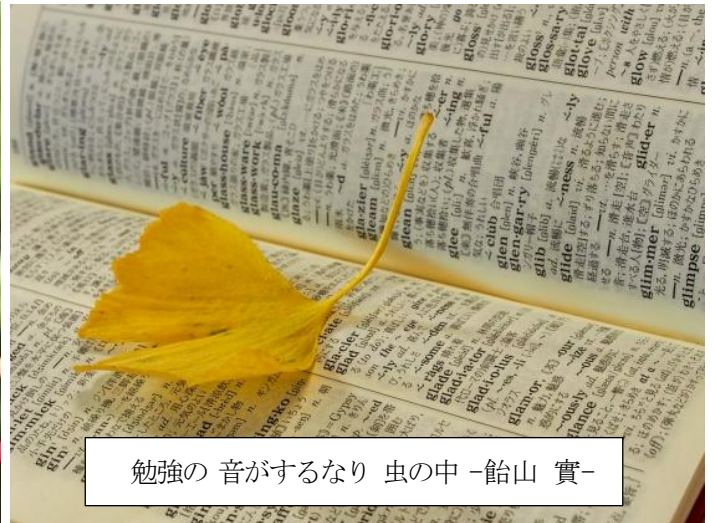
勉強の音がするなり 虫の中 -飴山 實-