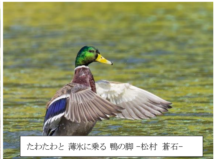
たわたわと 薄氷に乗る 鴨の脚 -松村 蒼石-