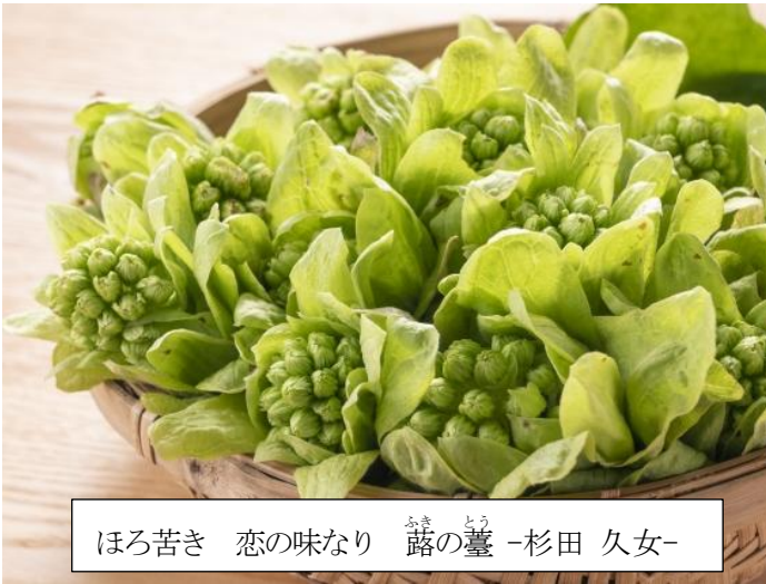
ほろ苦き 恋の味なり 露 かき の臺 とう -杉田 久女-